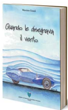
Massimo Grandi QUANDO LE DISEGNAVA IL VENTO Edizioni ASI

Written as a sort of travel journal and decorated with drawings in pencil and paint markers, this book by architect and designer Massimo Grandi, introduces the question of aerodynamics in motor-cars. This is an important milestone which prefigures the modern car, from both a technological and an architectural perspective and in terms of the aesthetic codes and stylistic languages. A tribute to the unique beauty of road, racing and record-setting cars. ■■■