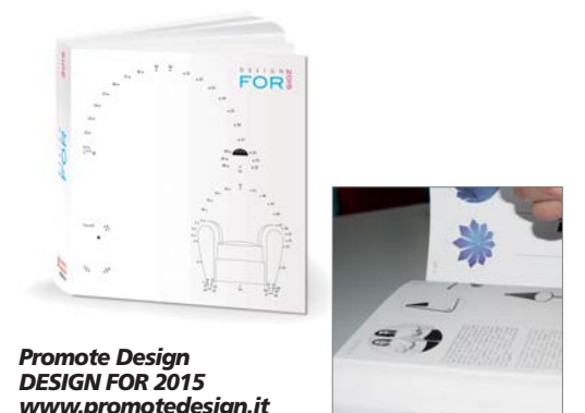
Promote Design DESIGN FOR 2015 www.promotedesign.it